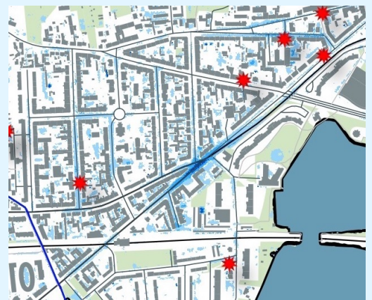
Auszug aus der Starkregengefahrenkarte von Potsdam

Bei einem tatsächlichen Ereignis können die überfluteten Gebiete allerdings von den Informationen in den Karten abweichen. Denn in Starkregengefahrenkarten werden nur einige wenige mögliche Ereignisstärken und Bedingungen erfasst. Dennoch sind sie eine wichtige Planungsgrundlage für Hausbesitzer und Städte.